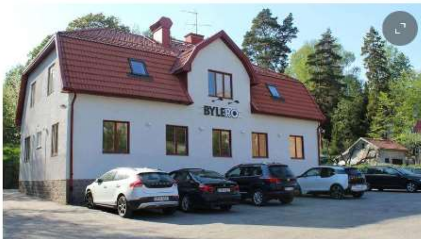
På Roslagsgatan ligger Byleros nya kontor. Nu finns bara en byggställning kvar då ett sista fönster ska målas.

Sedan 30-talet har villan funnits i Norrtälje och haft flera olika ägare genom åren. Innan det renoverades och blev till ett kontorslandskap ska huset ha tillhört både grosshandlare, polismästare, kommunen och privata ägare innan företaget Bylero för ett år sedan köpte det.